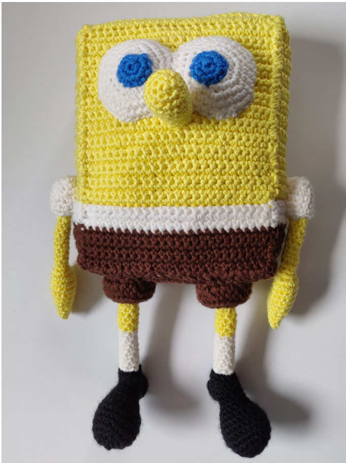
Afb 13. Neus en ogen bevestigen

Bevestig de ogen direct boven de neus en vul deze lichtjes op. Naai vervolgens de irisen en de pupillen vast bovenop het oogwit.