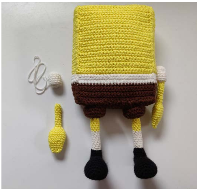
Afb 12. Maak de armen/mouwen vast aan het lichaam

Naai de armen vast in het midden van de mouw. Vervolgens de mouw vastmaken aan het lichaam, zorg ervoor dat de positie van de handen correct is voordat je deze vastzet. De armen/mouwen moeten in het midden zitten ten opzichte van de zijkant van het lichaam en het gele en witte gedeelte van het lichaam overlappen. Afb 12.