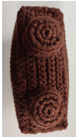
Afb 7. Bevestig de broekspijpen aan de onderzijde van het lichaam