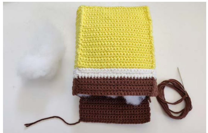
Afb 6. Vul het lichaam voordat je het dicht naait.