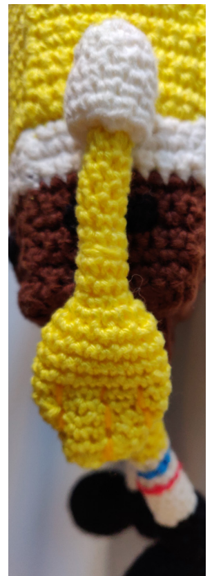
Afb 14. creer vingers