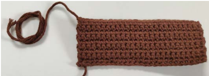
Afb 3. Lichaam onderkant

Rij 10: V in elke St, L 1, afbinden (25 Sts), Afb 3.