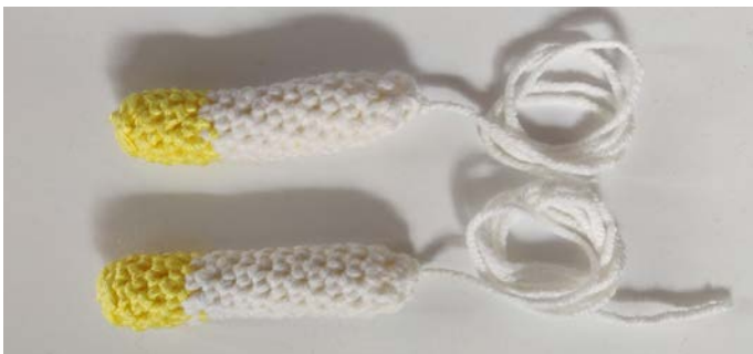
Afb 8. De benen

T 17: [Mind-2] x4 (4 Sts), Afbinden, laat een stuk garen zitten voor het naaien