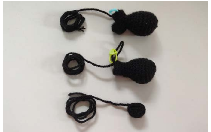
Afb 9. Naai de hiel aan de schoen