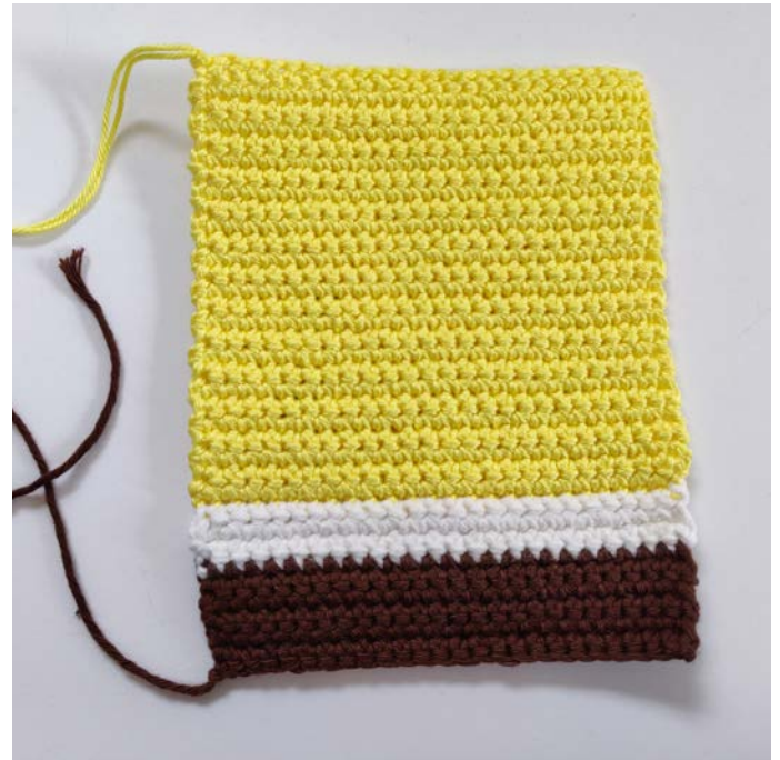
afb 1. Voor en achterkant

Rij 37: V in elke St, L 1, afbinden (25 Sts), afb 1.