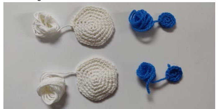
img 14. Ogen en irissen.

Start met een magische ring met 6 steken, bind af, laat een stuk garen zitten voor het naaien