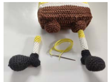
Afb 10 / 11. Schoen en been vastmaken aan het lichaam

Vervolgens het been met de schoen vastnaaien aan het midden van de broekspijp.