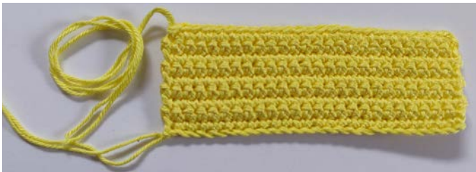
Afb 4. Hoofd bovenkant

Rij 10: V in elke St, L 1, afbinden, Afb 4.