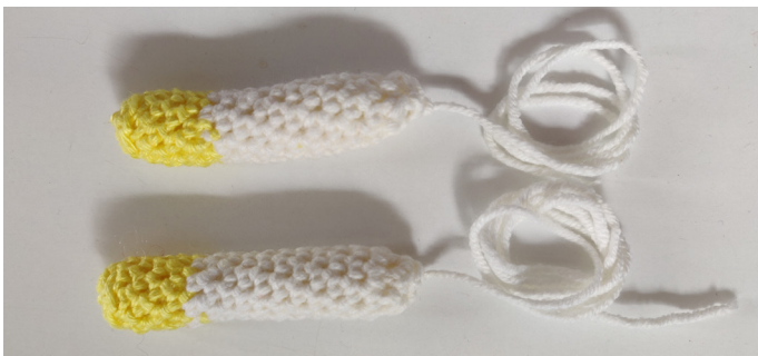
Afb 8. De benen

T 17: [Mind-2] x4 (4 Sts), Afbinden, laat een stuk garen zitten voor het naaien