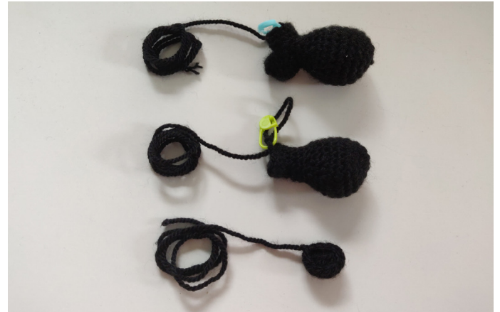
Afb 9. Naai de hiel aan de schoen