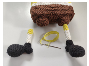
Afb 10 / 11. Schoen en been vastmaken aan het lichaam

Vervolgens het been met de schoen vastnaaien aan het midden van de broekspijp.