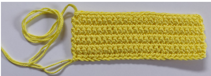
Afb 4. Hoofd bovenkant

Rij 10: V in elke St, L 1, afbinden, Afb 4.