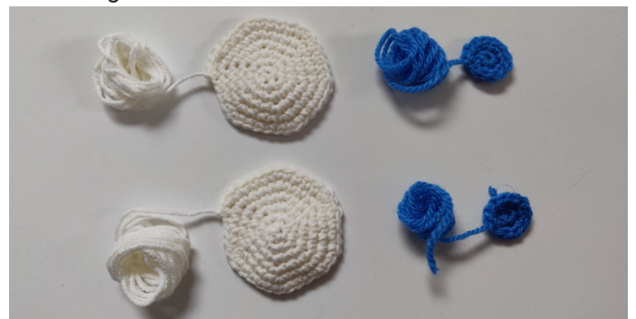
img 14. Ogen en irissen.

Start met een magische ring met 6 steken, bind af, laat een stuk garen zitten voor het naaien