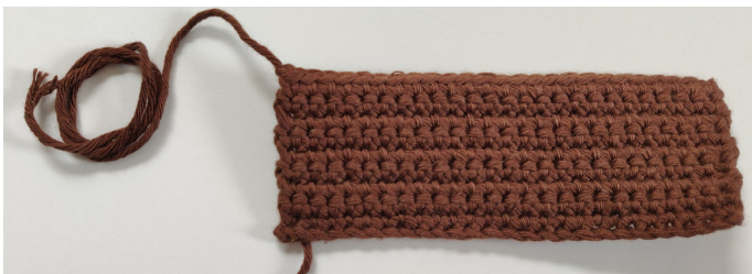
Afb 3. Lichaam onderkant

Rij 10: V in elke St, L 1, afbinden (25 Sts), Afb 3.